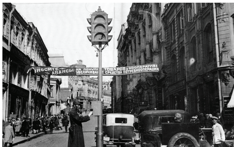
Первый электрический светофор в Москве, 1931 г.

И в том же 1924 году в Москве появился первый стрелочный светофор. Первый же электрический светофор современной конструкции появился в Москве шестью годами позже — в конце 1930 года.